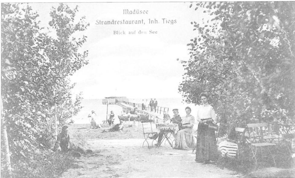
Ilustr. 2. „Jezioro Miedwie. Restauracja przy plaży, właśc. Tiegs. Widok na jezioro” – kartka pocztowa, Wilhelm Reisener, światłodruk, ok. 1912 r., MS/H/1339